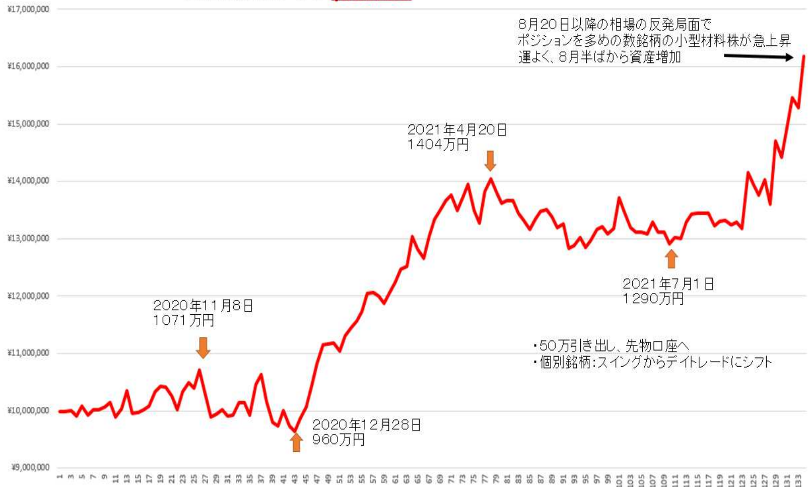
資産増加グラフ (税引き)